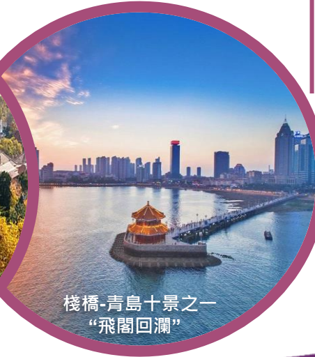
棧橋-青島十景之一 “飛閣回瀾”