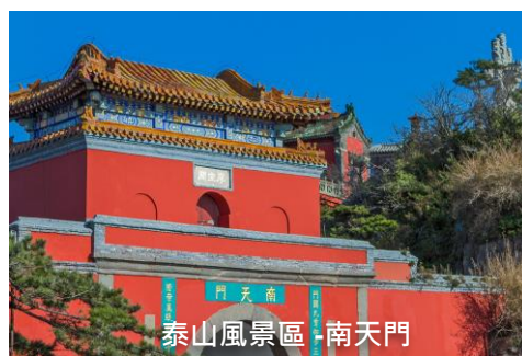
泰山風景區·南天門

出發日期：1月2,9,16,23日 2月6,13,20,27日、3月6,13,20日