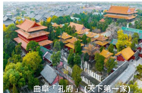
曲阜「孔府」(天下第一家)

南天門是泰山的一處重要關隘。南天門的建築風格獨特，是中國古代建築藝術的代表作之一。在這裏，你可以欣賞到泰山的雄偉壯觀和秀麗景色。