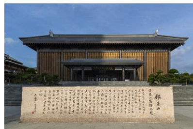
銀雀山漢墓竹簡博物館