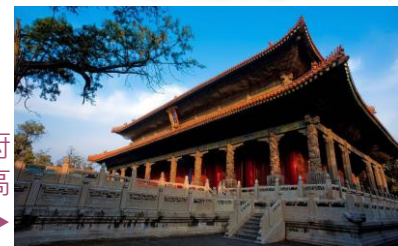
孔廟 (中國三大建築群之一)