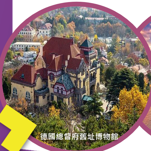
德國總督府舊址博物館

始建於1903年，青島啤酒是享譽中外的國際知名品牌·從建廠至今囊括了無數國際、國內大獎·現已行銷世界七十多個國家和地區。